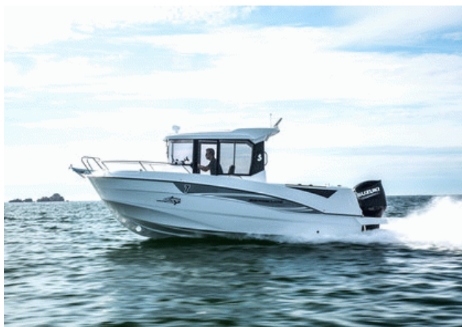
Beneteau Barracuda 7 S2