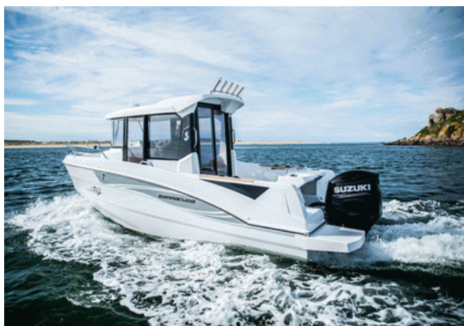
Beneteau Barracuda 7 S2