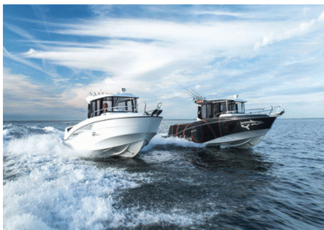
Beneteau Barracuda 7 S2