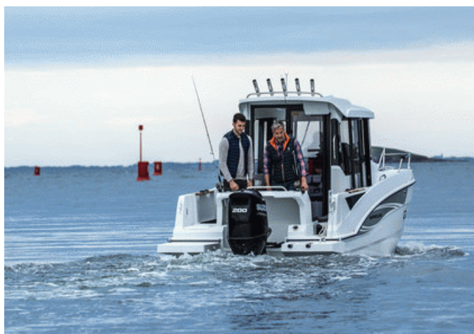
Beneteau Barracuda 7 S2