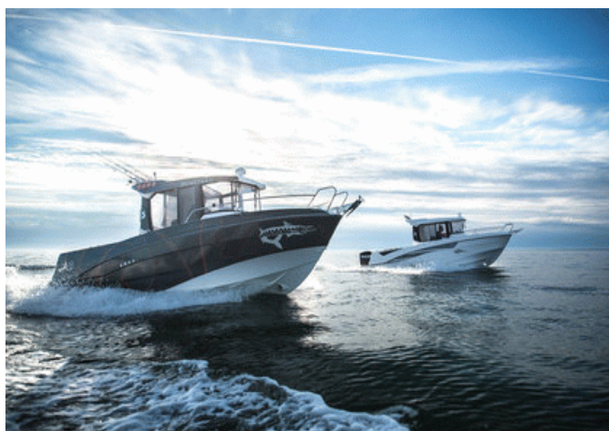
Beneteau Barracuda 7 S2