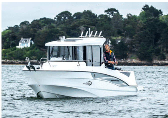
Beneteau Barracuda 7 S2